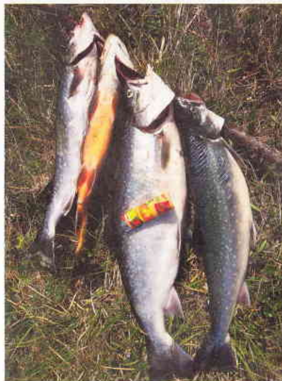
Flotte grønlandske fjeldørreder.

På min tur rundt i Sydgrønland traf jeg flere gange på en ivrig fransk fluefisker. Sidste gang jeg så ham var, da min kone og jeg vandrede ind igennem den smukke Blomsterdal ved Narsarsuaq for at komme ind til gletcheren. Elven i Blomsterdalen så rigtig god ud, og jeg kunne se, at den franske fluefisker fiskede nogle rigtig fine høller. Her var altså atter en fiskemulighed i vidunderlige Sydgrønland. ●