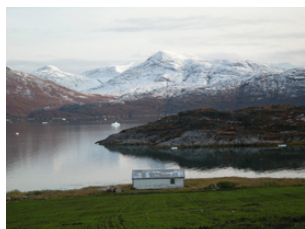
le printemps à Ipiutaq