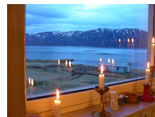
l'art de la rencontre