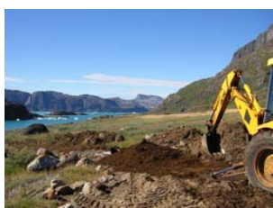
construction d'un chemin