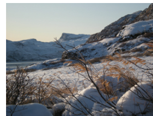
l'hiver à Ipiutaq