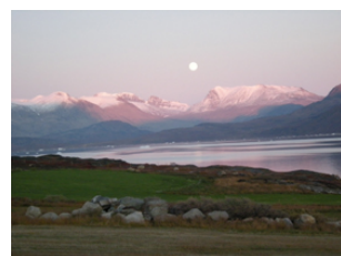
au bout du monde