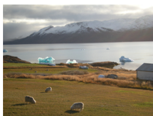
glaces et moutons