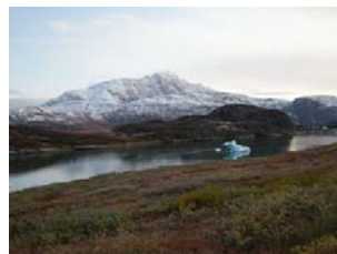
l'automne à Ipiutaq