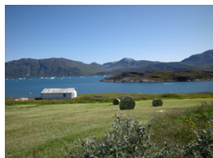
l'été à Ipiutaq